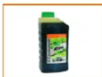
ACEITE DE CADENA BIODEGRADABLE