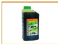
ACEITE DE CADENA BIODEGRADABLE