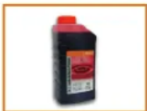
ACEITE DE MEZCLA