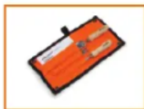
KIT DE AFILADO